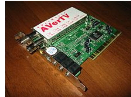
ТВ-тюнер AVerTV Studio фирмы AVerMedia с интерфейсом PCI

При подключении тюнер использует ресурсы компьютера, поэтому необходимо проверить, совместим ли он с операционной системой рабочего компьютера. Подавляющее большинство ТВ-тюнеров штатно комплектуется поддержкой для операционной системы Microsoft Windows . Также для Windows доступно значительное количество