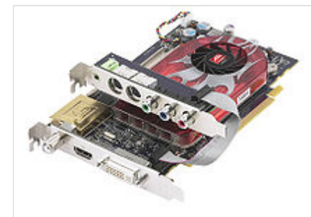
Видеокарта с ТВ-тюнером

Комбинированные ТВ-тюнеры конструктивно совмещены с видеокартой. С архитектурной точки зрения тюнер в таких решениях является, как правило, отдельным устройством. С видеокартой его объединяет только шина — PCI, AGP или PCI-E и программное обеспечение, автономная работа без загруженного драйвера невозможна. Широкий ассортимент подобных устройств предлагала компания ATI (линейка All-in-Wonder ). Проблема комбинированных ТВ-тюнеров в том, что сам тюнер устаревает значительно медленнее, чем графические видеокарты. Для стран СНГ также существенно, что некоторые продукты линейки All-in-Wonder (как и многие АЦП от ATI и AMD ) не поддерживают стандарт SECAM.