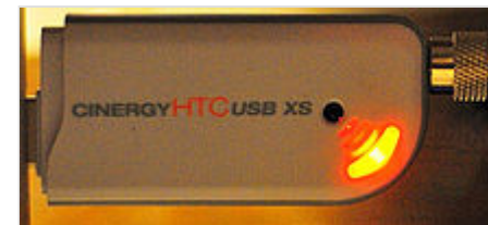
ТВ-тюнер с интерфейсом USB