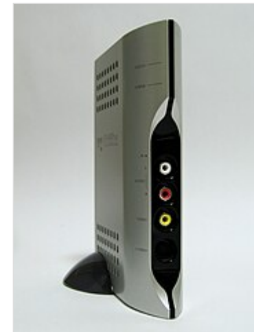
ТВ-тюнер, подключаемый непосредственно к монитору

ТВ-тюнеры, подключаемые к видеоинтерфейсу монитора, способны работать с любыми операционными системами.