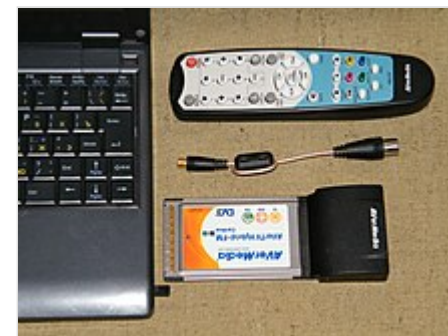
ТВ-тюнер фирмы AVerMedia с интерфейсом PCMCIA и ноутбук