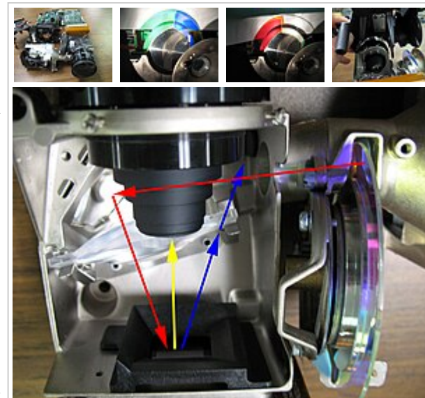
Устройство одноматричного DLP проектора. Красной стрелкой показан путь света от лампы к матрице, через диск светофильтров, зеркало и линзу. Далее луч отражается либо в объектив (жёлтая стрелка), либо на радиатор (синяя стрелка)

Цветное изображение формируется за счёт инерции зрения и высокой частоты смены частичных изображений. В большинстве случаев она дополнительно увеличивается для снижения заметности мельканий. При стандартной частоте проекции цифровых кинопроекторов, составляющей 24 кадра в секунду, каждый целый цветной кадр демонстрируется дважды, чтобы сместить частоту мельканий выше критической границы заметности. Это достигается удвоенной частотой вращения диска с цветными светофильтрами или их двойным набором на одном диске, вращающемся со стандартной скоростью. Получаемый эффект аналогичен эффекту от «холостой лопасти» обтюратора , используемой во всех плёночных кинопроекторах.