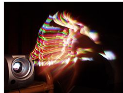
«Эффект радуги» DLP при быстром движении руки зрителя

Главным недостатком одноматричных DLP-проекторов считается так называемый «эффект радуги», проявляющийся в разноцветных контурах на изображении при быстрых движениях глаз зрителей. Это объясняется временны́м параллаксом из-за последовательной, а не одновременной проекции частичных цветоделённых изображений. Явление наиболее заметно при низкой частоте вращения диска со светофильтрами, и не исчезает полностью даже при очень быстрой смене цветов. Однако, повышение частоты вращения цветоделительного диска снижает эффект, поэтому большинство производителей постоянно совершенствует этот параметр. Наибольшего успеха удаётся достичь в светодиодных проекторах за счёт очень высокой частоты обновления. Эффект радуги также заметен при быстрых движениях зрителей, на которых попадает свет, отражённый от экрана. В этом случае могут быть отчётливо видны отдельные фазы движения, отображающиеся разными цветами.