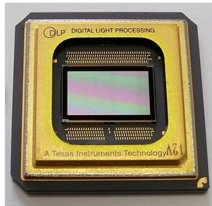
Микрозеркальная микросхема DLP