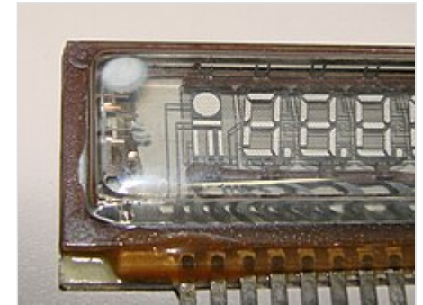
Белое пятно сигнализирует о нарушении герметичности колбы индикатора

Геттер , аналогичный геттеру обычных радиоламп, расположен в баллоне индикатора на специальном держателе сбоку таким образом, чтобы не мешать выходу из него светового излучения, или выполнен в виде металлического напыления на колбе. При нарушении герметичности вакуум нарушается и геттер становится белым (см. рис.), что может служить способом контроля целостности индикатора.