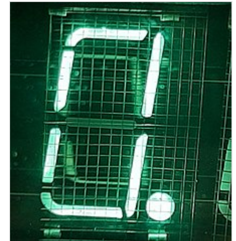
Свечение анодов-сегментов под сеткой в индикаторе ИВ-18

Аноды покрыты люминофором с небольшой энергией возбуждения, составляющей всего несколько электрон-вольт. Именно этот факт и позволяет лампе работать при низком анодном напряжении, так как люминофор хорошо возбуждается электронами низкой энергии. Светятся сегменты и при освещении лампой чёрного света , энергия фотонов которой при длине волны в 380 нм составляет всего 3,27 эВ: