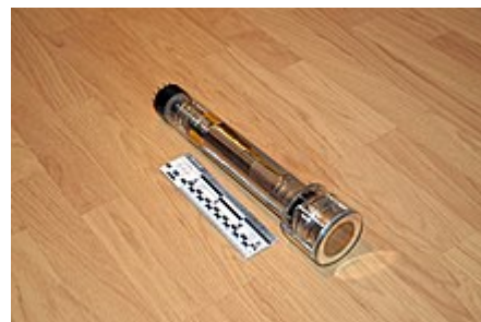
Радиолампа ЛИ-207 Суперортикон, СССР 1969 год

Границей между секциями была двусторонняя мишень со слабой проводимостью. С противоположной от фотокатода стороны находилась электронная пушка, сканировавшая мишень под воздействием скрещённых полей катушек развёртки. Но напряжённость электрического поля была подобрана так, что вначале электроны ускорялись и фокусировались, а затем тормозились, и, не долетая до мишени долей миллиметра, поворачивали назад, где и попадали в секцию умножения. При неосвещённом фотокатоде все электроны до мишени не долетали, а если на мишени был потенциальный рельеф, часть электронов луча долетала до мишени и оседала на ней, уменьшая ток луча, попадавшего в секцию умножения.