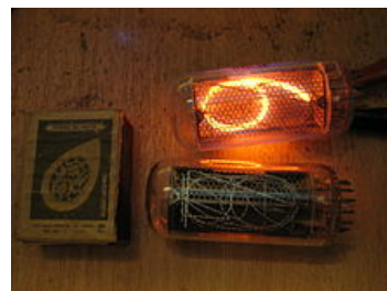
Отечественный газоразрядный индикатор ИН-18

ИН-7, ИН-7А, ИН-7Б — спецсимволы, оформление баллона — бесцокольное, индикация через торец баллона, выводы жесткие.