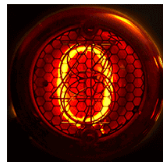
Газоразрядный индикатор GN-4 на десять цифр