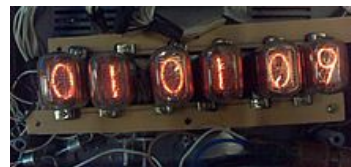
При желании на газоразрядных индикаторах можно выполнить не только часы, но и календарь.

За последние годы популярность газоразрядных индикаторов возросла из-за их необычного антикварного вида. В отличие от ЖК, они излучают мягкий неоновый оранжевый или фиолетовый свет. Несколько компаний предлагают часы и иные конструкции, в которых используются газоразрядные индикаторы. Для корпусов таких часов применяется дерево, сталь, акриловый пластик. Как правило, такие часы обладают небольшим функционалом и несут чисто эстетическую функцию.