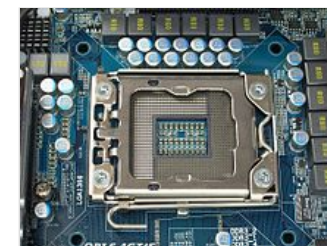
Разъём LGA 1366