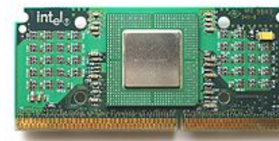
Intel Celeron 300A