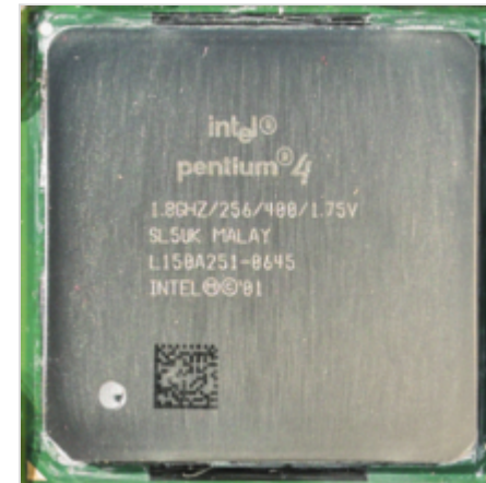
Pentium 4 1800 на ядре Willamette (FC-mPGA2)

Характерной особенностью процессоров Pentium 4 на ядре Northwood была невозможность продолжительной работы при повышенном напряжении ядра (повышение напряжения ядра при разгоне является распространённым приёмом, позволяющим повысить стабильность работы на повышенных частотах [25] ). Повышение напряжения ядра до 1,7 В приводило к быстрому выходу процессора из