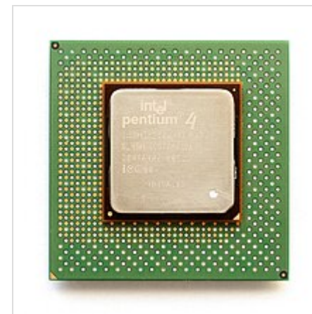
Pentium 4 ( Socket 423 )

Поздние процессоры на ядре Willamette, процессоры Pentium 4 на ядре Northwood, часть процессоров Pentium 4 Extreme Edition на ядре Gallatin и ранние процессоры на ядре Prescott с 2001 по 2005 год [5] выпускались в корпусе типа FC-mPGA2, представлявшем собой подложку из органического материала с закрытым теплораспределительной крышкой кристаллом с лицевой стороны и 478 штырьковыми контактами, а также SMD-элементами - с обратной (размеры корпуса — 35×35 мм).