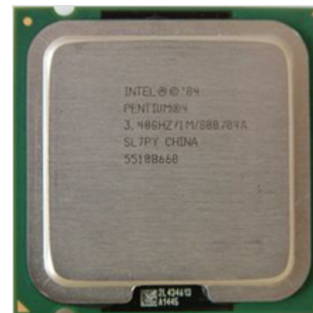
Pentium 4 3400 на ядре Prescott (LGA 775)