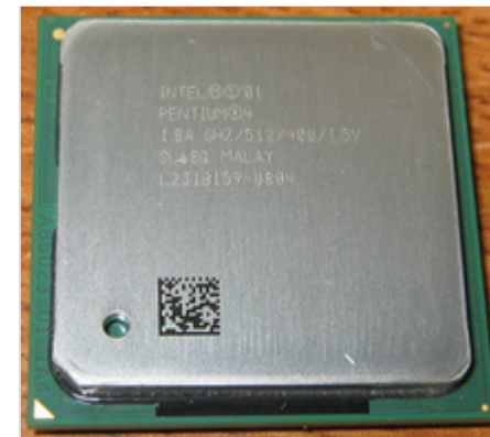
Intel Pentium 4 1800 на ядре Northwood