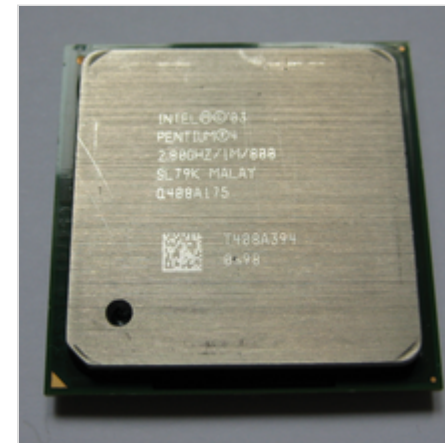
Pentium 4 2800E на ядре Prescott (Socket 478)

Несмотря на то, что процессоры на ядре Prescott производились по новой 90-нм технологии, добиться снижения тепловыделения не удалось: так, например, Pentium 4 3000 на ядре Northwood имел типичное тепловыделение 81,9 Вт, а Pentium 4 3000E на ядре Prescott в корпусе типа FC-mPGA2 — 89 Вт. Максимальное тепловыделение процессоров Pentium 4 на ядре Prescott составляло 151,13 Вт на частоте 3,8 ГГц [19] .