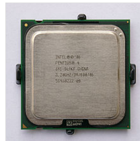
Pentium 4 641 на ядре Cedar Mill

Существовало четыре модели процессоров Pentium 4 на ядре Cedar Mill: 631 (3 ГГц), 641 (3,2 ГГц), 651 (3,4 ГГц), 661 (3,6 ГГц). Все они работали с частотой системной шины 800 МГц, предназначались для установки в системные платы с разъёмом LGA775 , поддерживали технологию Hyper-Threading , EM64T , XD-bit , а в последних ревизиях C1/Do обзавелись ещё и энергосберегающими EIST , C1E и технологией защиты от перегрева TM2 . Однако, на более старых материнских платах, без поддержки микросхемой питания ЦП новых силовых режимов и пониженных напряжений, компьютер попросту не запустится. Напряжение питания этих процессоров было в пределах 1,2—1,3375 В, параметр TDP составлял 86 Вт для процессоров степпингов B1 и C1, в ревизии Do этот показатель удалось уменьшить до 65 Вт.