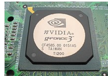
GPU nVidia GeForce 3 Ti 200

Профессор Джек Донгарра (Jack Dongarra), Директор Инновационной вычислительной лаборатории Университета штата Теннесси, 2011