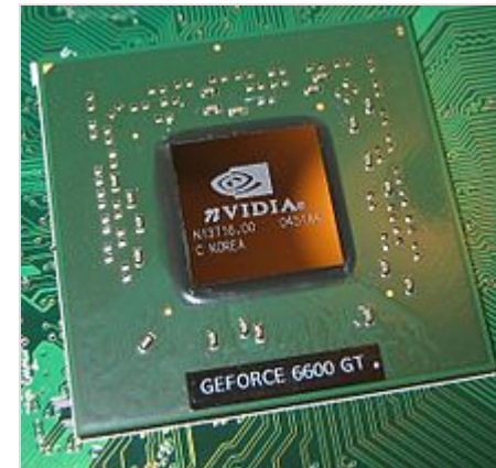
GeForce 6600GT (NV43) GPU

Поколения ускорителей в видеокартах можно считать по версиям DirectX и OpenGL , которую они поддерживают.