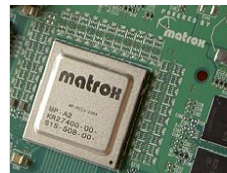
GPU Matrox Parhelia